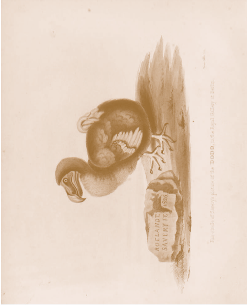
The Dodo and its Kindred (1848) by Strickland and Melville, after Roland Savery

Tot slot: niets van dit alles had plaats kunnen vinden zonder de residents die ontzettend veel van hun kunde en kennis met ons hebben gedeeld op en met Reinwardt Academie om te werken aan wat het betekent om te bezitten en begrijpen.